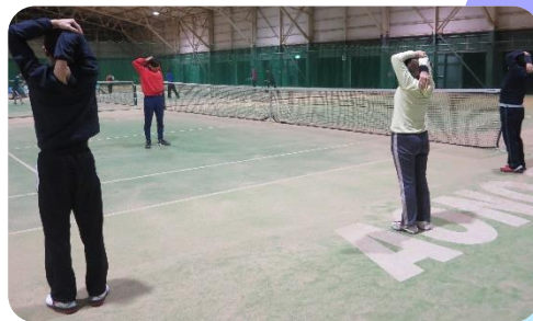
レッスンスタート、まずは準備体操!