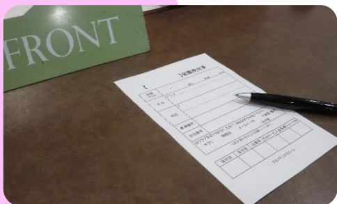
フロントにて体験の受付をします