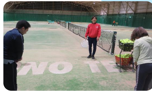
レッスン終了、お疲れ様でした。