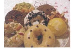
※イラストはイメージです